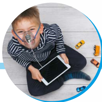
durante il gioco

Grazie a Link si è finalmente liberi di continuare a lavorare, studiare, giocare, e muoversi durante il trattamento.